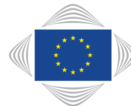
European Committee of the Regions